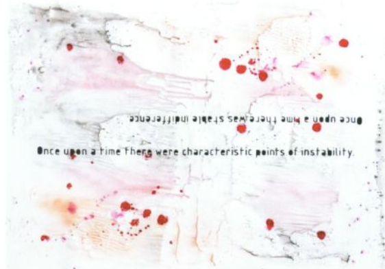
Charlotte Mumm, Once upon a time, 2014, mixed media/Papier

"The force that through the green fuse drives the flower