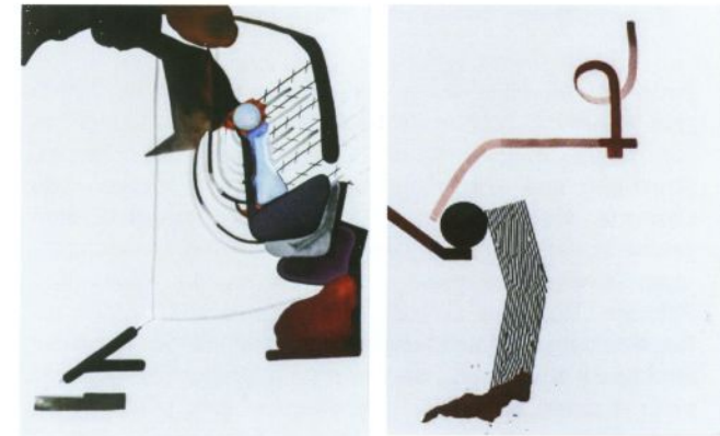
Charlotte Mumm, möblierte Portraits z, y, 2013, mixed media/Stoff

And I am dumb to mouth unto my veins How at the mountain spring the same mouth sucks The hand that whirls the water in the pool Stirs the quicksand; that ropes the blowing wind Hauls my shroud sail.